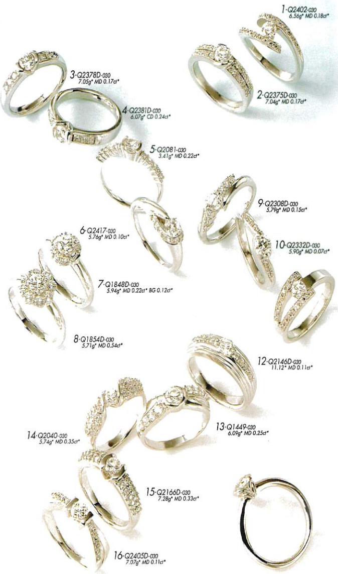
1-Q2402-030 6.56g MD 0.18ct*