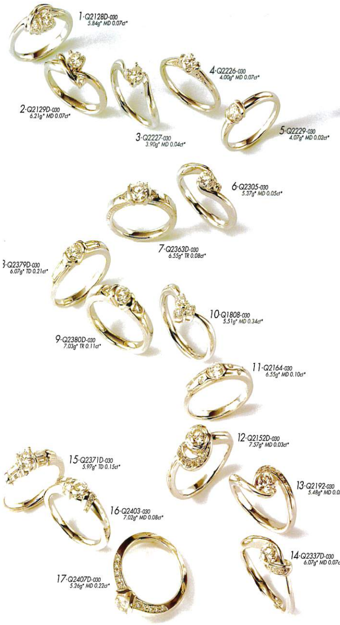
1-Q2128D-030 5.84g MD 0.07ct*